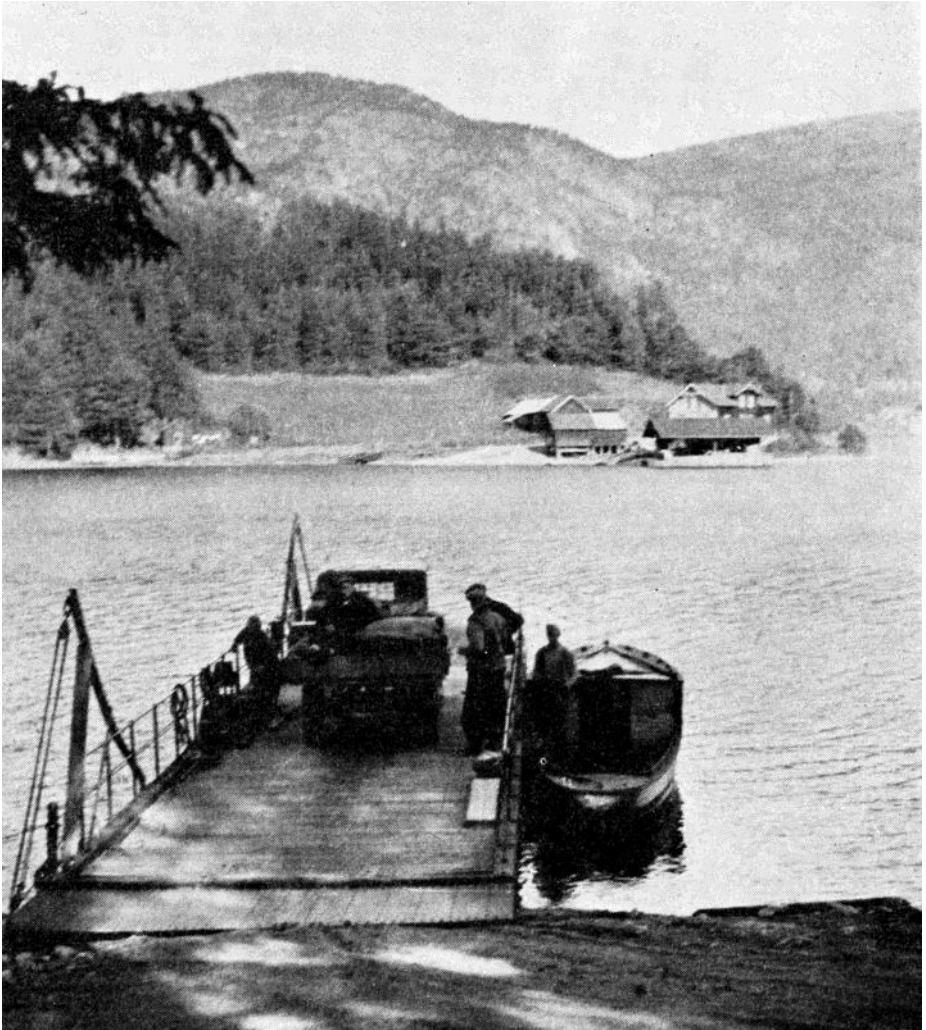
Ferjestedet ved Spjotsodd